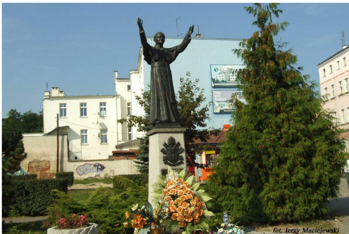
Pomnik św. Jana Pawła II na pętli tramwajowej w Leśnicy

dochodzimy do ul. Alojzego Majchra, mijamy dwa wysokie wieżowce, drogą prowadzącą koroną wału przeciwpowodziowego wzdłuż Bystrzycy dochodzimy do pętli tramwajowej w Leśnicy.