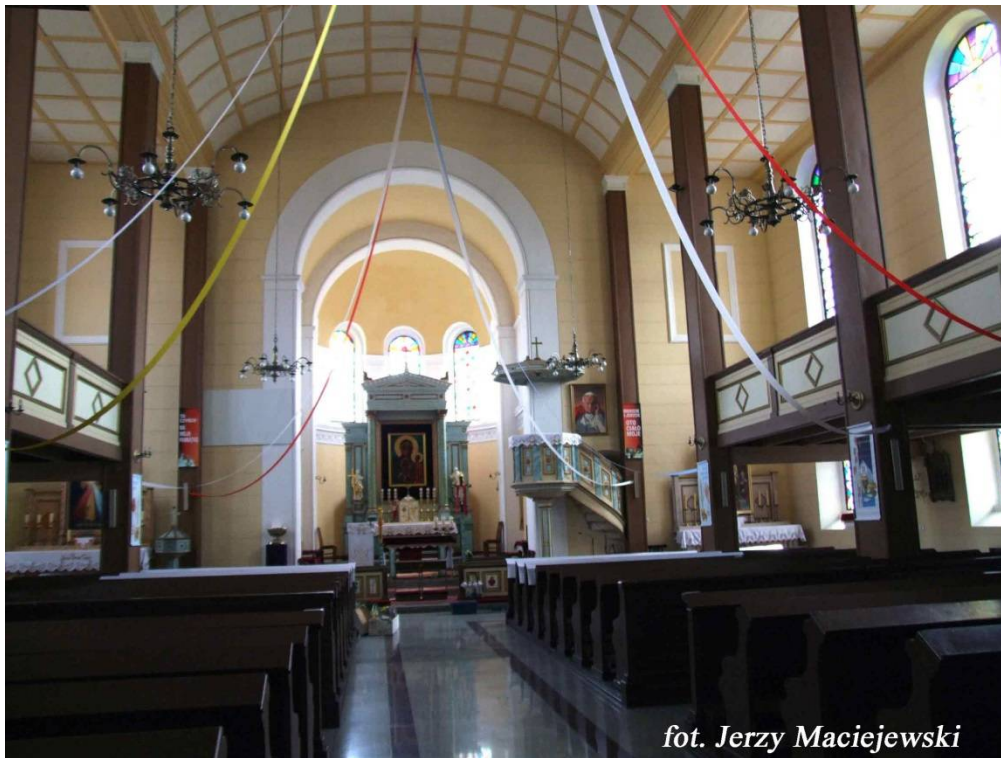
Wnętrze kościoła p. w. Matki Boskiej Królowej Polski,