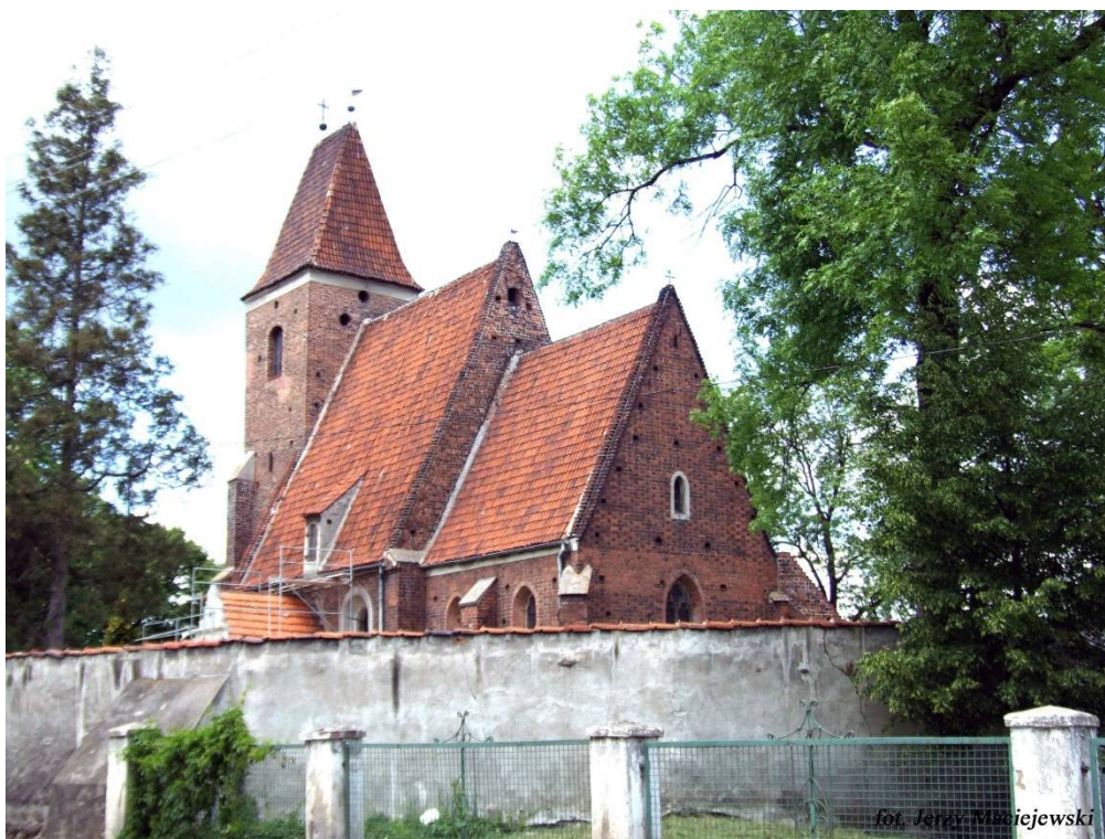
Obok od strony zach., kościół pomocniczy p. w. św. Jadwigi , wzm. w 1316 r. Obecny, gotycki wzn. w XIV w., rozbudowany o nawę w 2 poł. XV, restaurowany w 1822 r. i w l. 1973 - 75. Orientowany, murowany, jednonawowy z prostokątnym prezbiterium, nakryty sklepieniem krzyżowym ze zwornikami,