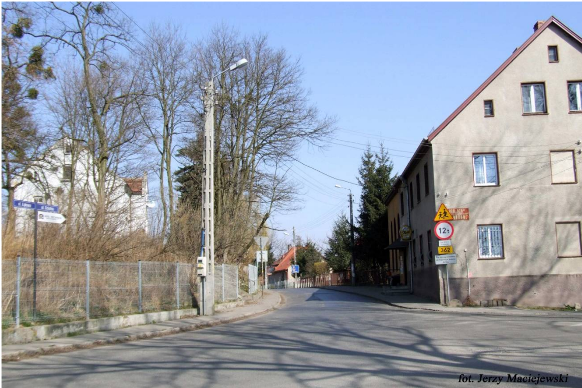
Skalka - wieś ulicówka położona na wschodniej krawędzi doliny Bystrzycy, na pd. – zach. od Wrocławia , komunikacja samochodowa, sklep spożywczy. Wieś wymieniona w dokumentach w 1250 r., jako Scalca, w 1310 r.