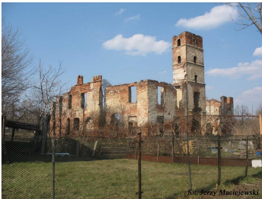
fol. Jerzy Maciejewski

Wieś wzmiankowana w dokumentach jako Schmolcz w 1343 r. Smolec jest nazwą kulturową oznaczająca pierwotne miejsce wytapiania smoły. Pośród zabudowy wsi wyróżnić należy domy z k. XIX w. z charakterystycznymi cechami stylowymi.