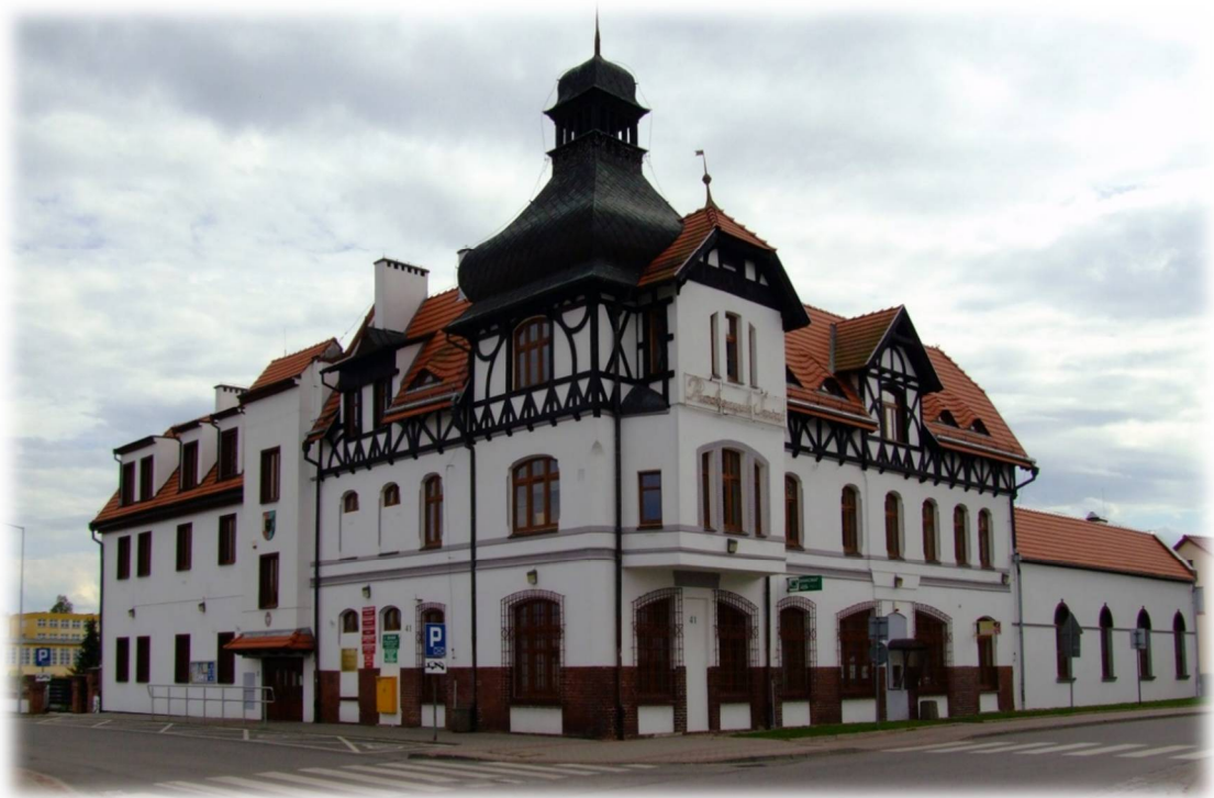
Ratusz - niegdyś była to willa zamożnych przedsiębiorców miękińskich z 1906 r., która po gruntownej przebudowie i remoncie od 1990 r. pełni obecną funkcję siedzibę władz gminy.