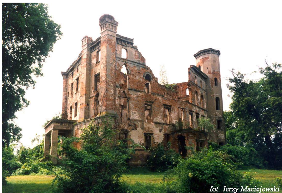
Zamek usytuowany jest na niewielkim wzniesieniu nad Odrą, na pd. od centrum wsi, prawdopodobnie na terenie grodu pochodzącego z XIII w. To przykład typowego zamku nizinnego. Była to pierwotnie siedziba kasztelana, wzm. po raz pierwszy w 1250 r.. Otoczony jest fosą i wałem. Murowany z cegły i kamienia polnego oraz rudy darniowej. Założony na planie zbliżonym do trójkąta równobocznego, siedmioosiową fasadą zwrócony na pn. Trzypiętrowy, z ośmioboczną, pięciokondygnacyjną wieżą na pn. – zach. narożu, podpiwniczony. Obecnie pierwotny układ pomieszczeń, na skutek zawalenia się większości ścian wewnętrznych