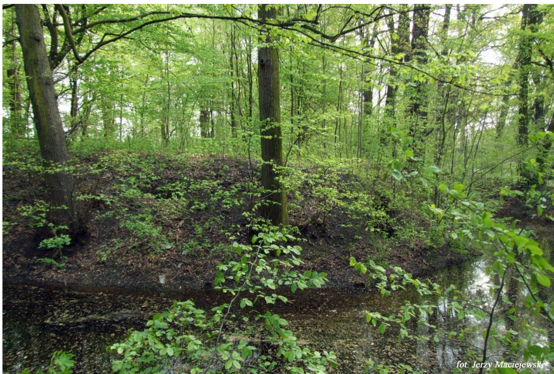
fol. Jerzy Maciejewski

Najstarsza wzmianka o Sołtysowicach pochodzi z 1312 r., gdy zapisano ją pod nazwą Schullheschowycz. Badania na tutejszym grodzisku wykazały istnienie grodu od XIII w. Wiadomo, że w 1346 r. Ilertelin z Głogowa sprzedał wieś klasztorowi św. Wincentego z Olbina, w 1390 r. klasztor odkupił dalsze 3,75 łana od Jana, aptekarza z Wrocławia. W 1868 r. uruchomiono linię kolejową Wrocław - Oleśnica ze stacją w Sołtysowicach, co dało asumpt do rozwoju gospodarczego w następnym okresie. W czasie II wojny był tu obóz pracy przymusowej. Do Wrocławia osadę włączono w 1951 r.