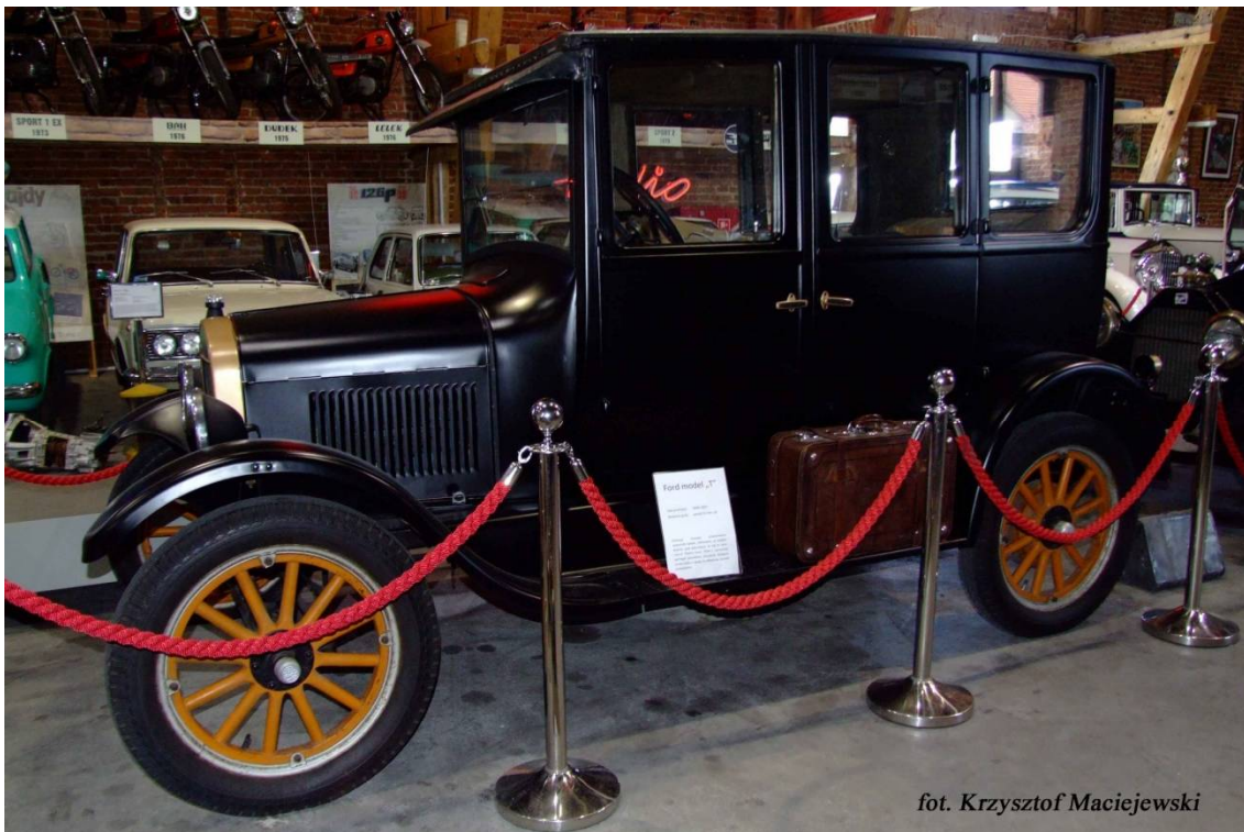
fol. Krzysztof Maciejewski