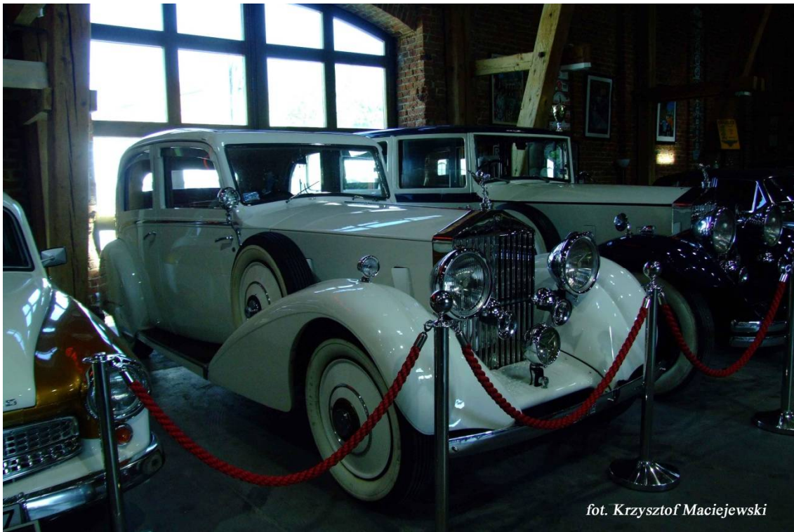
fol. Krzysztof Maciejewski